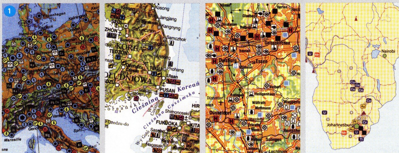
Obr. 1 – Zdá se vám, že uvedené výřezy map jsou čitelné? Poznáte, co znaky vyjadřují? Rozlišíte je od sebe a poznáte, ke kterým bodům, liniím, a plochám jsou znaky přiřazeny?