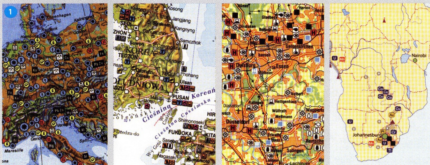
Obr. 1 – Zdá se vám, že uvedené výřezy map jsou čitelné? Poznáte, co znaky vyjadřují? Rozlišíte je od sebe a poznáte, ke kterým bodům, liniím, a plochám jsou znaky přiřazeny?